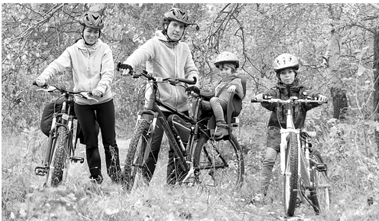
Катание на велосипеде отлично тренирует сердце

Болезни сердца — главная причина смерти людей в любом возрасте, хотя многие думают, что их эта проблема не коснется. При этом по-прежнему весьма живучи мифы о сердечных болезнях.