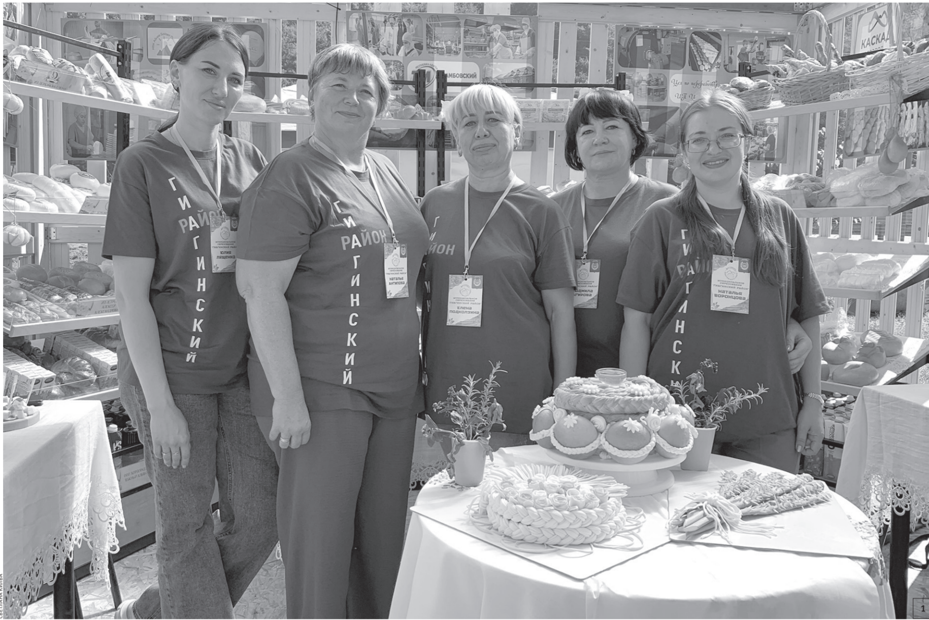
1. На подворье Гиагинского района; 2. Длина этой сырной косички — 189 метров!

— Посмотрите, что у нас кипит на костре, — указал он в сторону огромного чугунного казана, над которым кодовали четыре мастерицы. И правда, аромат стоял потрясающий. — Это щипс кипит, всего 150 литров. А вот мастерицы по тесту сегодня с утра уже пожарили 3,5 тысячи всеми любимыми халужей (пирожки с сыром) и еще будут жарить, потому что людей все больше и больше. Приятного всем аппетита!