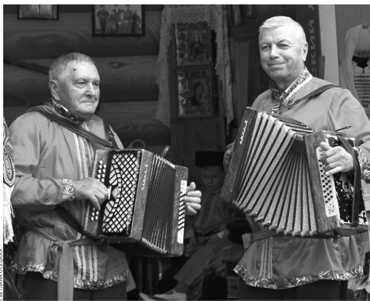
Русское подворье на праздновании Дня республики

Они сообщили, что работа движения «Русь» по муниципальным районам за предыдущие годы была направлена на поддержание добрососедских отношений с народами многонациональной республики, популяризацию самобытной культуры русского народа среди населения для сохранения нашей национальной идентичности и культурного наследия. Члены районных отделений принимали активное участие в проведении региональных и государственных праздничных мероприятий, в православных праздниках, помогали ветеранам Великой Отечественной войны, проводили дни славянской письменности, фестивали русского фольклора, выставки, мастер-классы русских народных промыслов. Также в Зеленчукском районе оказывали помощь в организации молодежного форума культурного и духовного развития детям Луган-