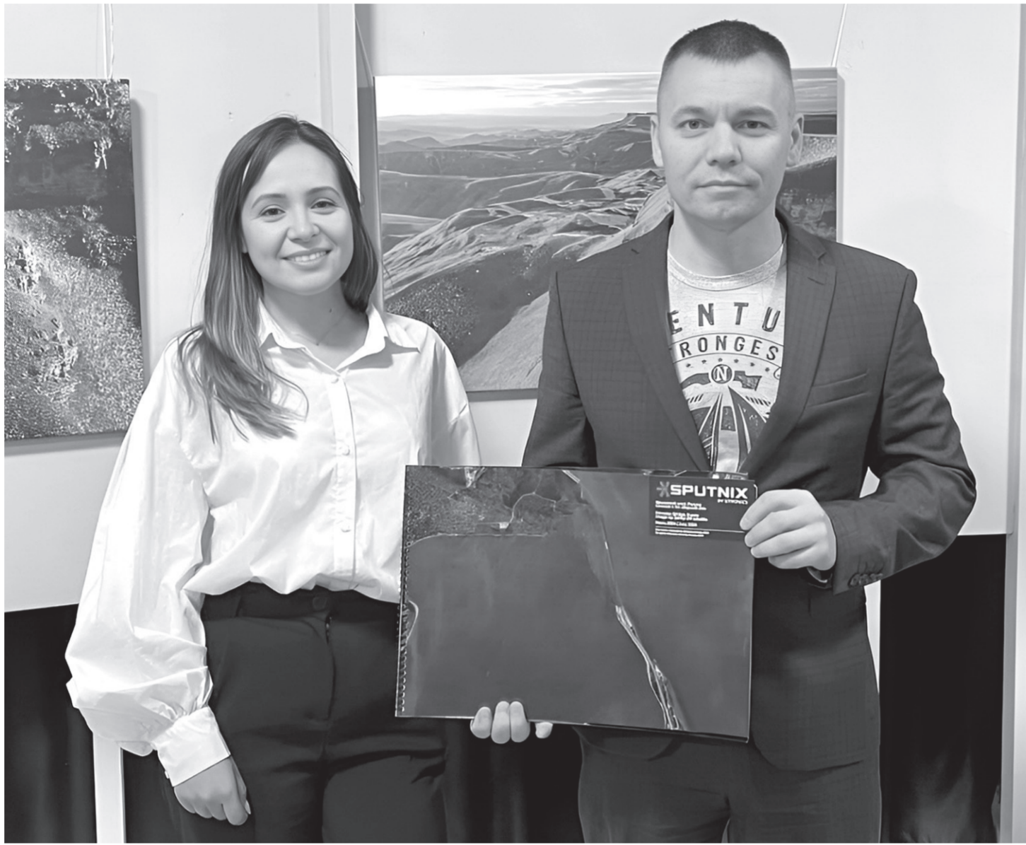
Заместителю министра цифрового развития, связи и массовых коммуникаций РФ Андрею Заренину, посетившему на форуме мастер-класс по конструированию спутников, организованной компанией «Спутникс», был подарен альбом-сборник спутниковых снимков городов России — яркий пример возможностей современных технологий

Сегодня адаптация страны к новым вызовам в различных отраслях экономики и государственном управлении стала необходимостью. И потому концепция форума была сформулирована достаточно четко: во исполнение указа Президента РФ совместно с руководителями федеральных и региональных органов исполнительной власти, представителями бизнеса и научно-образовательных организаций создать комплексный сервис на основе данных космоса, беспилотных и пилотируемых летательных аппаратов, наземных датчиков и устройств. Такой формат общения позволил выработать возможности современной обработки данных и сконцентрироваться на прикладных аспектах их использо-