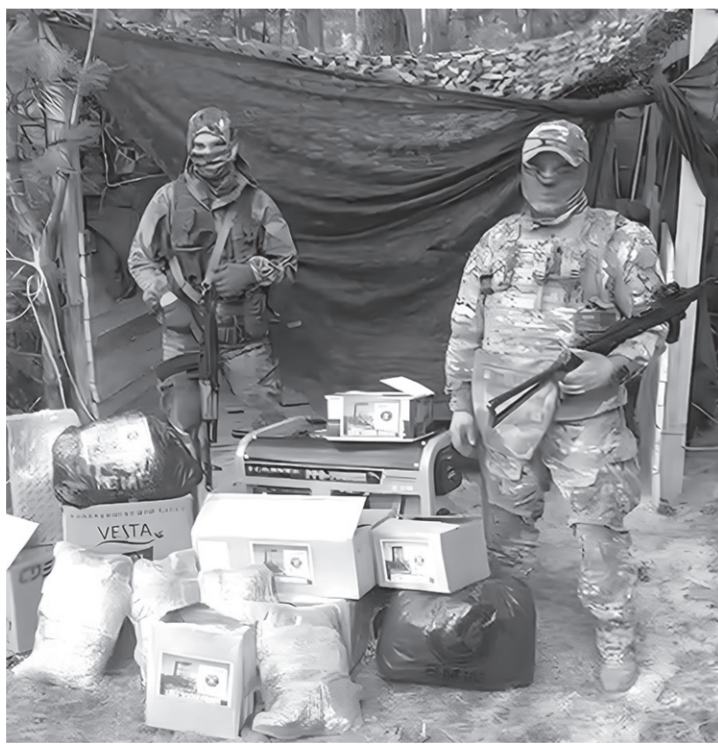
Бойцы получили гуманитарную помощь от родных